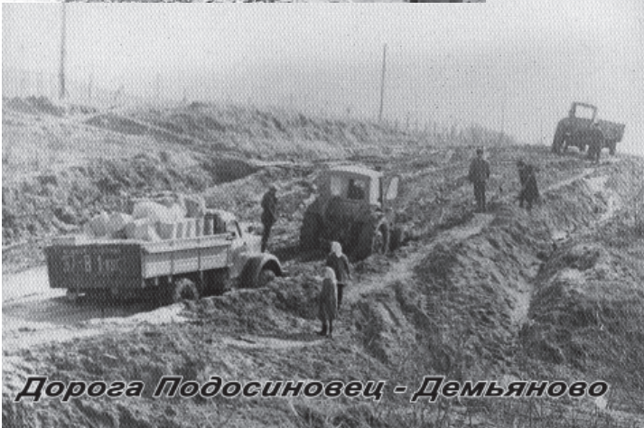
Дорога Подосиновец - Демьяново